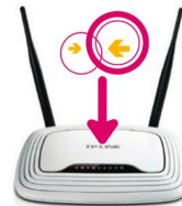
Ein neuer Freifunk-Router